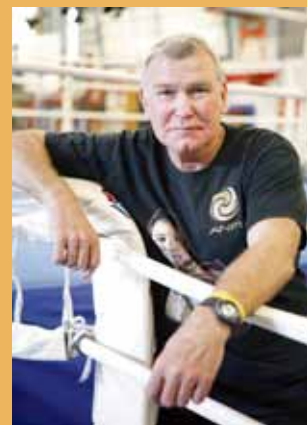
Meistertrainer Fritz Sdunek

Sturm: Köln ist meine Stadt. Man hat den 1. FC Köln, der Fußball spielt eine große Rolle, vor allem seitdem mein Freund Lukas Podolski wieder hier spielt. Ich bin mir sicher, dass man hier auch eine Box-Hochburg aufziehen kann. Ich denke, wir können auf die Welle der Begeisterung vom Fußball aufspringen.